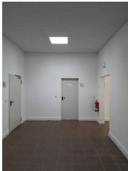
Vorraum Lastenaufzug, Gang zum Gewerberaum / Lager