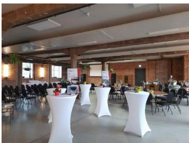
FARWERK Eventhaus, großer Eventraum: Seminare | Schulungen | Tagungen | Kongresse | Firmenfeiern

Unser "Mehrwert": Bau | Sanierung, Datenschutz, Brandschutz, Event- und Veranstaltungsmanagement (FARWERK Eventhaus), Werbung | Marketing (Plakatwerbung), Objektpflege, Reinigung, Wartung von Technik.