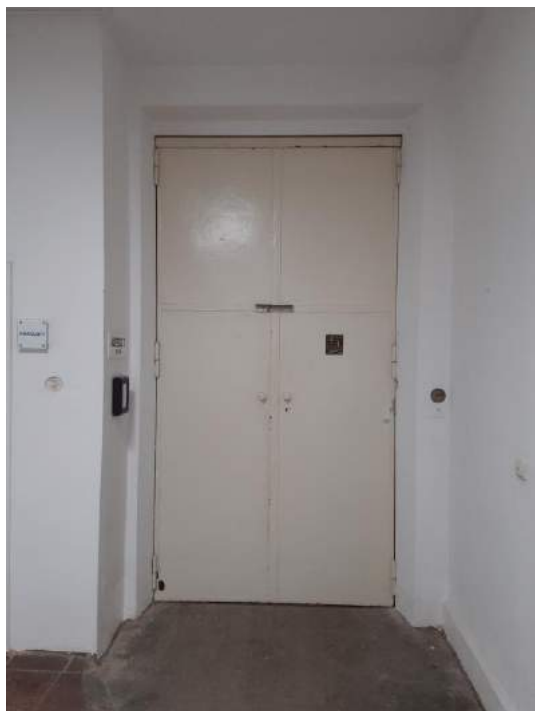
Lastenaufzug zum Gewerberaum / Lager