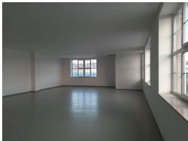
Gewerberaum / Lager