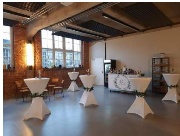
FARWERK Eventhaus, kleiner Eventraum: Seminare | Schulungen | Tagungen | Kongresse | Firmenfeiern