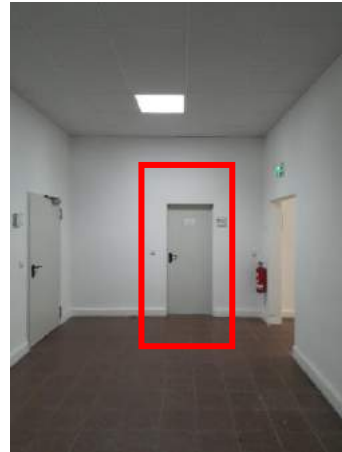
Vorraum Lastenaufzug, Eingang Büro / Lager (rot umrandet)