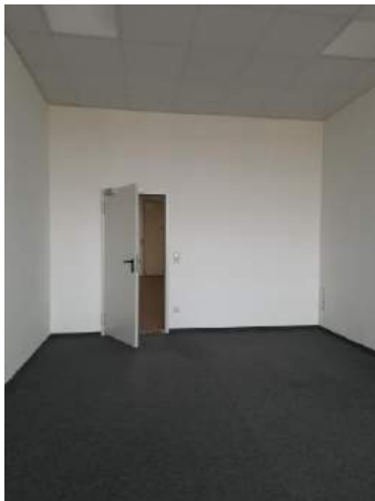
Büro / Lager