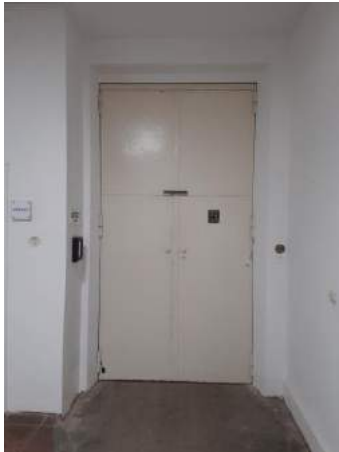
Lastenaufzug zum Büro / Lager