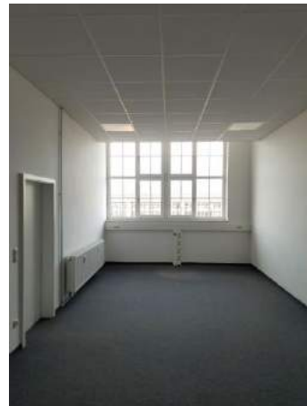
Büro / Lager

Der Gewerberaum kann als Büro oder Lager genutzt werden. Dem Mieter steht ein Lastenaufzug unmittelbar gegenüber des Gewerberaums zur gemeinschaftlichen Nutzung zur Verfügung. Eine Be- und Entladefläche im EG vor dem Lastenaufzug ist vorhanden.