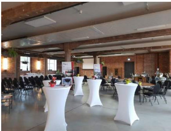
FARWERK Eventhaus, großer Eventraum: Seminare | Schulungen | Tagungen | Kongresse | Firmenfeiern

Unser "Mehrwert": Bau | Sanierung, Datenschutz, Brandschutz, Event- und Veranstaltungsmanagement (FARWERK Eventhaus), Werbung | Marketing (Plakatwerbung), Objektpflege, Reinigung, Wartung von Technik.