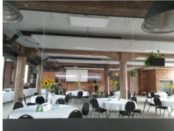
FARWERK Eventhaus: Seminare | Tagungen | Kongresse | Firmenfeiern