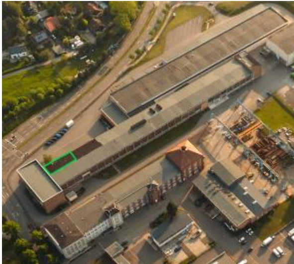
Teilfläche einer Lagerhalle grün markiert