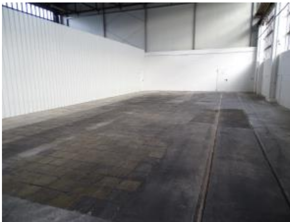
Teilfläche einer Lagerhalle

Die Lagerfläche ist mit einem LKW-befahreren Rolltor ausgestattet. Die Fläche ist mit einem Industriezaun und einem abschließbaren Tor zu anderen Lagerflächen abgegrenzt.