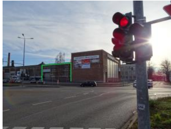
Teilfläche einer Lagerhalle grün markiert