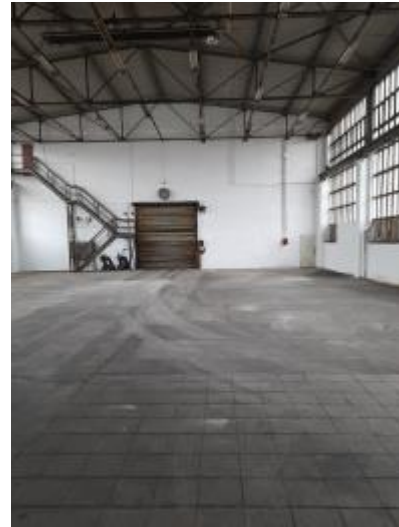
Lagerhalle 470 m 2 im sanierten Zustand

Die Lagerhalle ist mit einem Lkw-befahreren Rolltor ausgestattet.