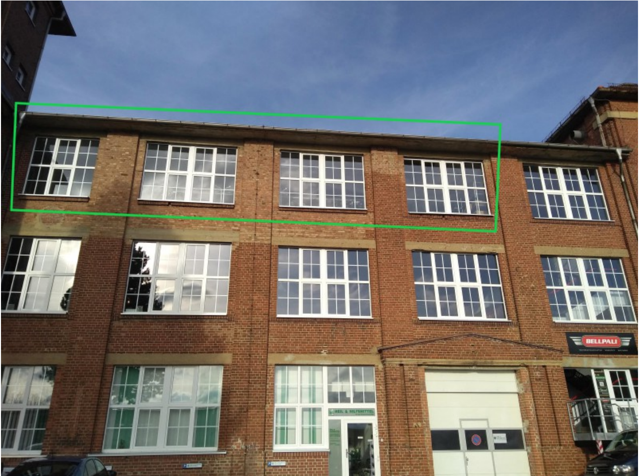
Werkstatt / Lager / Büros (grün markiert)

Die Mietfläche kann nach individueller Absprache mit dem neuen Mieter saniert werden. Hierbei können viele eigene Ideen in den Ausbau der neuen Mieteinheit einfließen. Eine Nutzung der 125 m 2 ist als Werkstatt / Lager oder auch Büroeinheit möglich. Die Fläche zeichnet sich durch ihre hellen Räume und einem sehr schönen Blick in das angrenzende Erzgebirge aus. Ein Lastenaufzug steht für die Nutzung zur Verfügung.