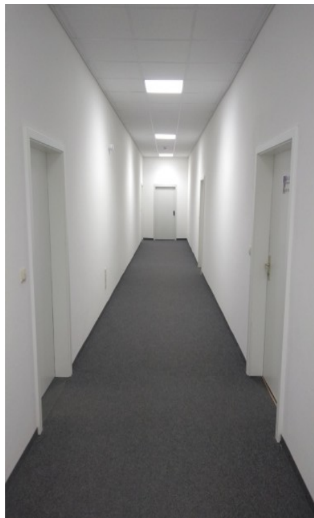
Lager / Büro

FARADIT Gewerbepark GmbH Bernsdorfer Straße 291 09125 Chemnitz